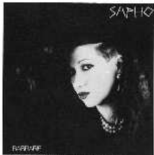
「呪いのバルベリー」(L23B-1086)