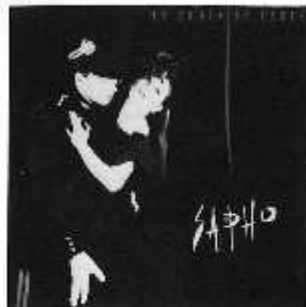
「パリ・エクスプレス」(L25B-1105) ※