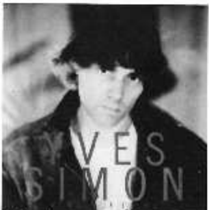
「明日にアクション」(L28R-1085)